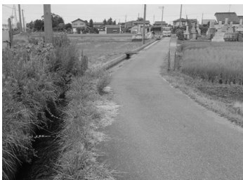
幅が狭い通学路の横にある用水路