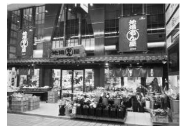
「地場もん屋」の様子

農業者の皆さんの所得増大に向けて、農産物や加工品等の出荷先の1つとして、地場もん屋への出品もご検討ください。