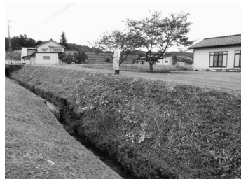
法面の勾配が急な排水路