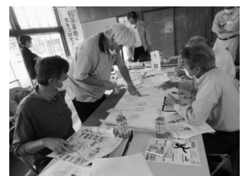
ワークショップの様子(水落地区)