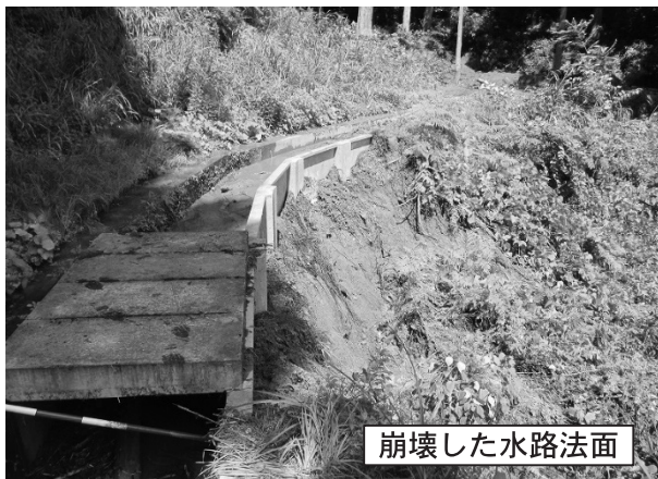
崩壊した水路法面