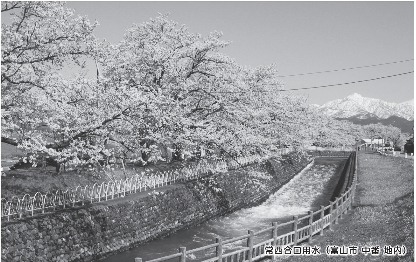
常西合口用水（富山市 中番 地内）

とやま市農政だより編集委員会 富山市新桜町 7 番 38 号 TEL 076-443-2080 農 家 戸 数 … 6,570 戸