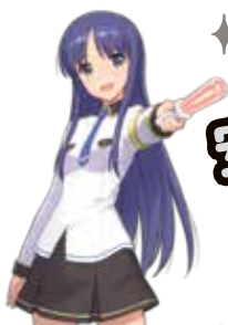
富山市防犯 イメージキャラクター 風間あおい