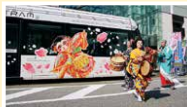
▲パレードのゴールには、ポスターデザインのラッピング電車。