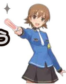
富山市防犯 イメージキャラクター 神通ゆい