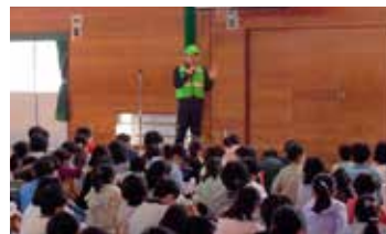
パトロール隊出発式(広田小学校)

また、令和4年に「特殊詐欺ゼロ戦隊・だまさレンジャー」を結成し、こども園や介護施設、ショッピングセンターなどで啓発運動を実施しています。