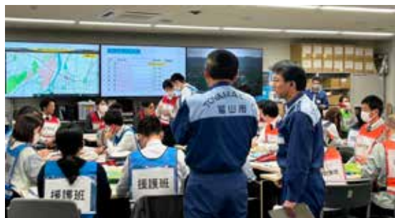
災害対策本部に参集し活動する市職員

そして、「備えていたことしか、役には立たなかった。備えていただけでは、十分ではなかった」。今一度、この東日本大震災の教訓を胸に刻みたい。