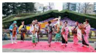
▲県庁前公園などで、まちなかステージでの演奏が行われた。