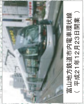
富山地方鉄道市内電車環状線 (平成21年12月23日開業)