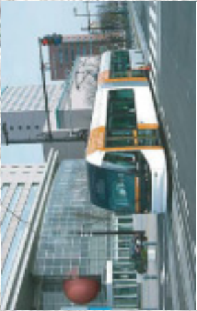
富山ライトレール(平成18年4月29日開業)