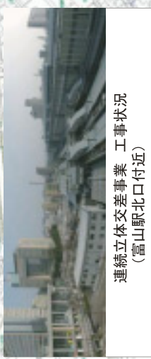
連続立体交差事業 工事状況 (富山駅北口付近)