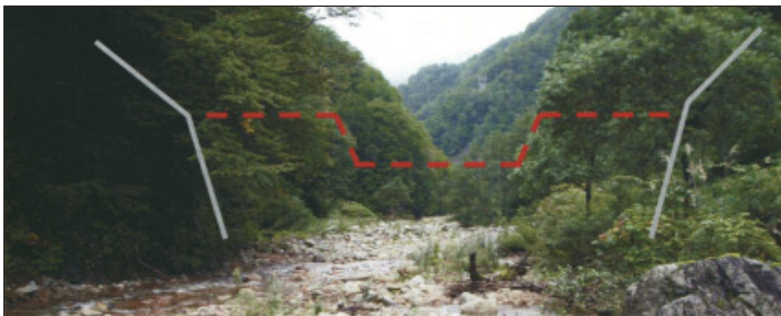
有峰地区（砂防事業）