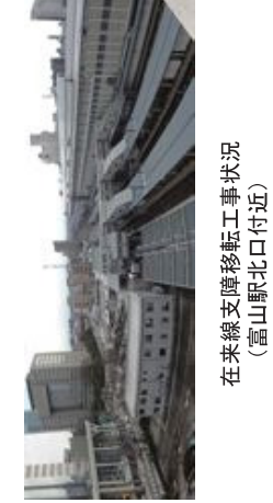
在来線支障移転工事状況 (富山駅北口付近)