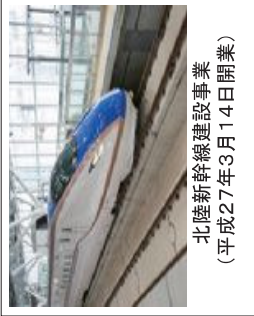
北陸新幹線建設事業 (平成27年3月14日開業)