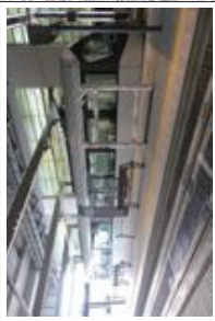
路面電車南北接続事業(第1期) (平成27年3月14日開業)