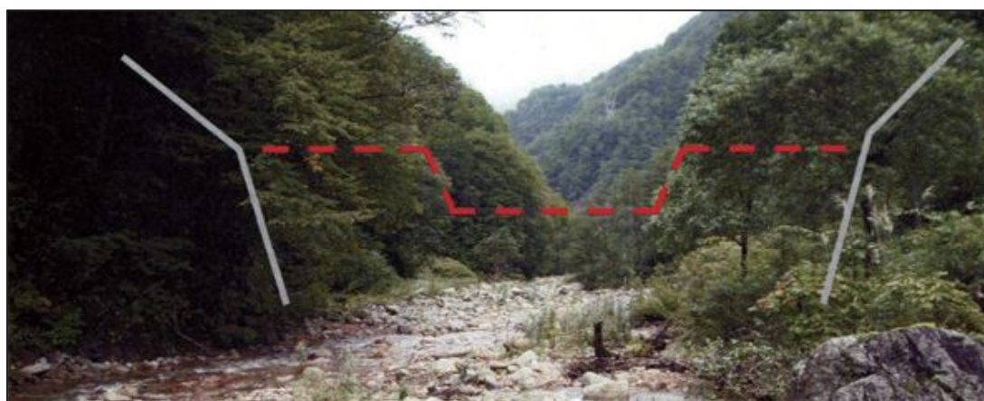
有峰地区（砂防事業）