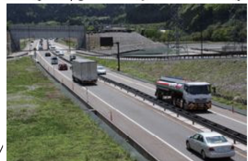
【猪谷楡原道路】完成区間（第3工区）