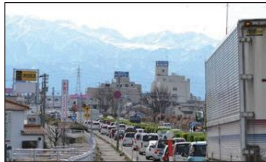
[国道8号] 富山市豊田町一丁目付近