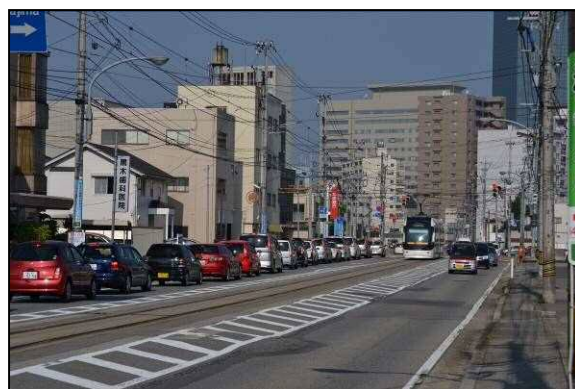
【綾田北代線】 永楽町地内