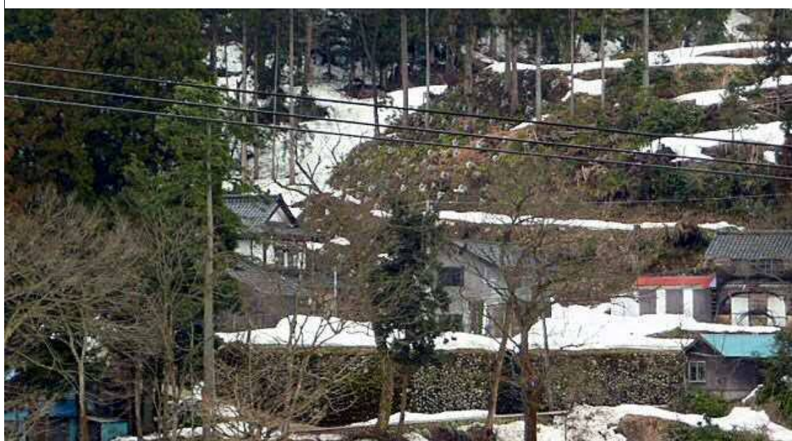
八尾町青根地区（地すべり対策事業）