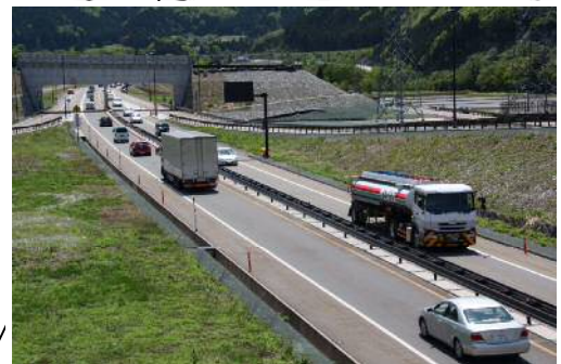
[猪谷榆原道路] 完成区間（第3工区）