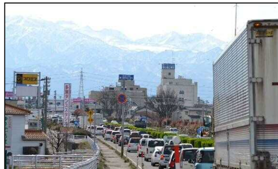
[国道8号] 富山市豊田町一丁目付近