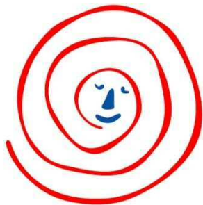
環境モデル都市富山 ECO-MODEL CITY TOYAMA