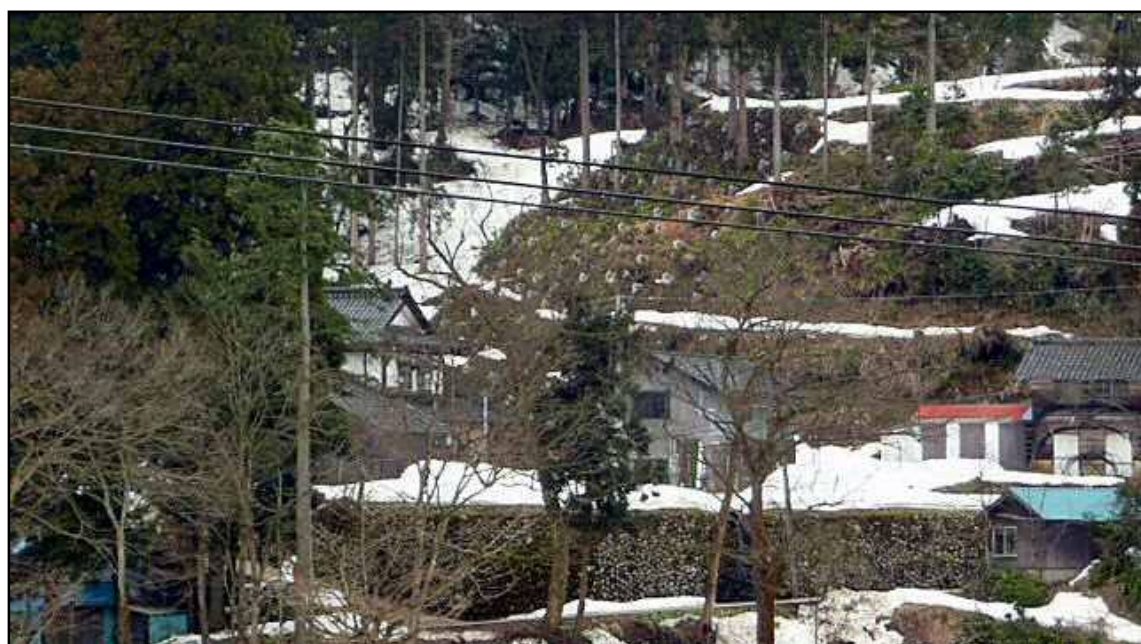
八尾町青根地区（地すべり対策事業）