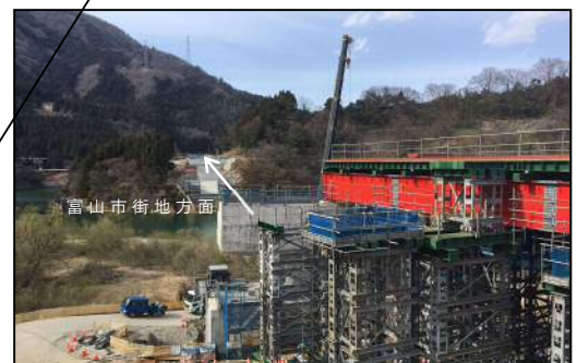
(仮称)猪谷橋 施工状況 (平成31年3月 富山市猪谷地内)