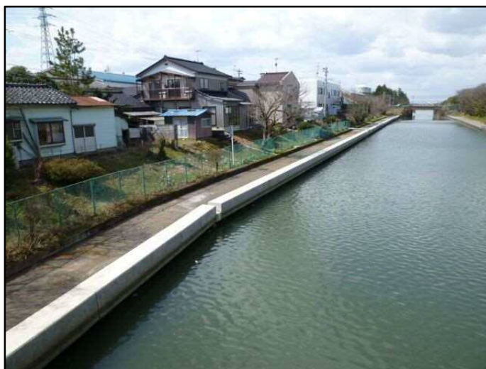
住友運河（遊歩道・緑地の整備）