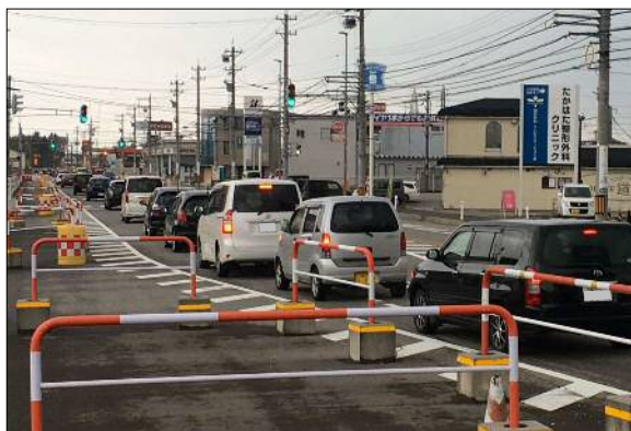
【東岩瀬線】 上野新町地内