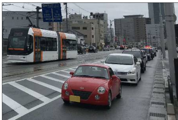
【綾田北代線】 永楽町地内