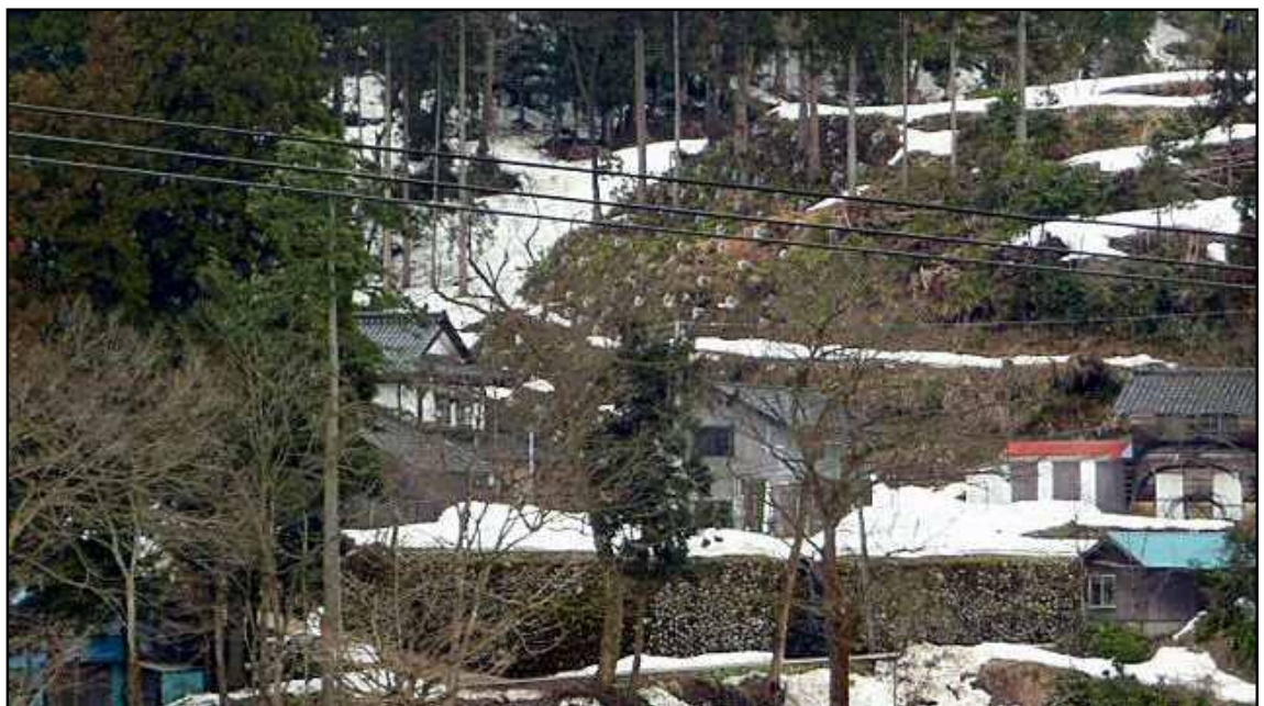
八尾町青根地区（地すべり対策事業）