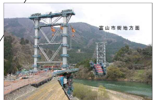
(仮称)猪谷橋 施工状況 (令和2年4月 富山市猪谷地内)