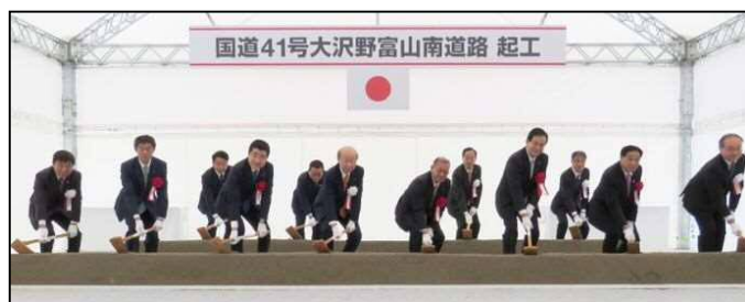
国道41号大沢野富山南道路起工式 (令和元年10月27日 富山市惣在寺地内)