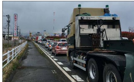
〔国道8号〕 富山市豊田町一丁目付近