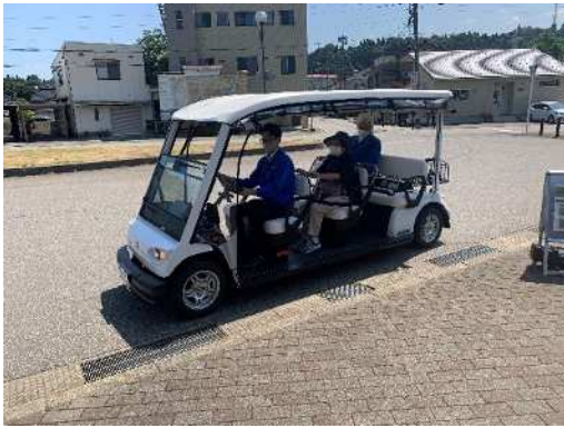
グリーンスローモビリティ運行事業