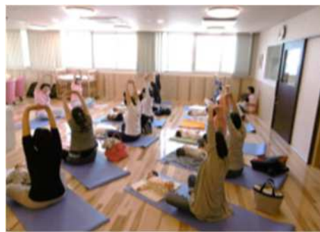
連携中枢都市圏事業（産後ケア）