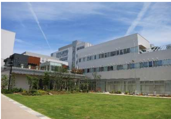
まちなか総合ケアセンター