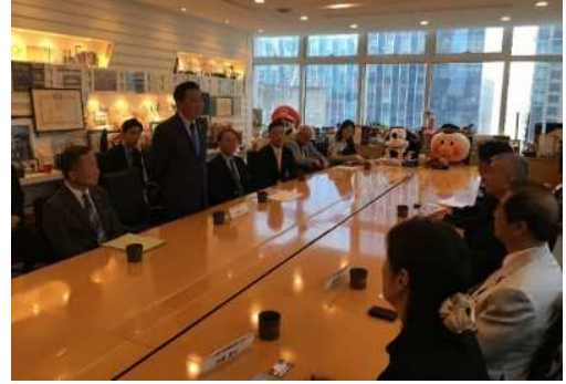
海外の旅行事業者向けのプロモーション