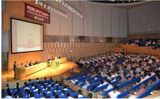
国際会議の開催支援