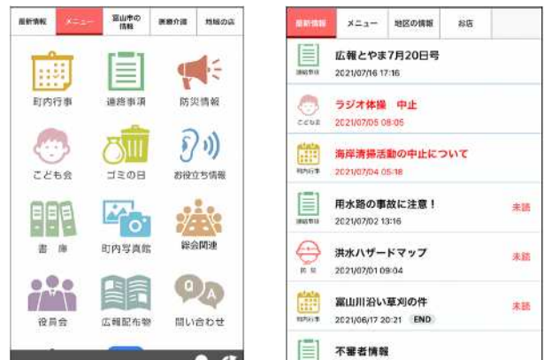
電子回覧板(イメージ)