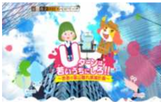
富山市就活全力応援サイト