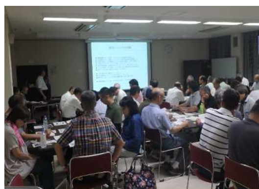
自主防災組織リーダー研修会