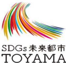
「SDGs 未来都市 TOYAMA」のロゴマーク