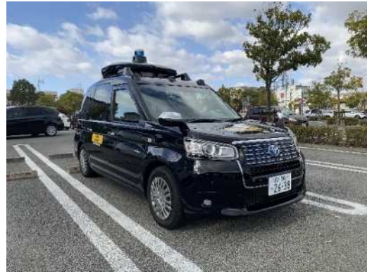
自動運転実証実験事業