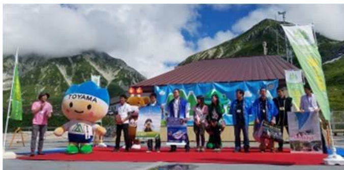
連携中枢都市圏事業（合同観光プロモーション）