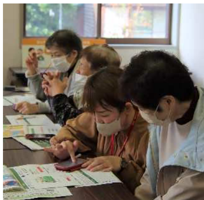
スマホ買物支援事業