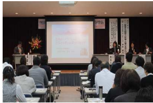
妊娠・子育て応援シンポジウム