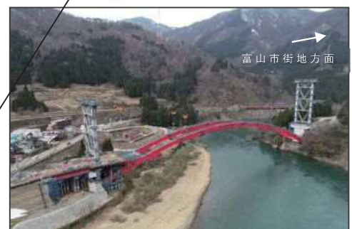
(仮称)猪谷橋 施工状況 (令和3年3月 富山市猪谷地内)