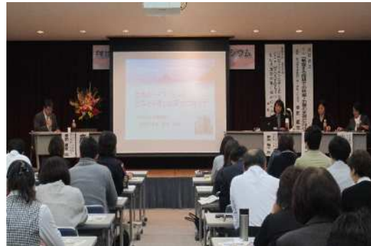
妊娠・子育て応援シンポジウム