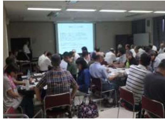
自主防災組織リーダー研修会