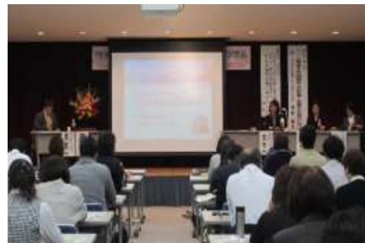
妊娠・子育て応援シンポジウム