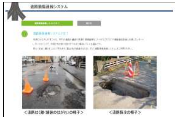
ライフライン共通プラットフォーム