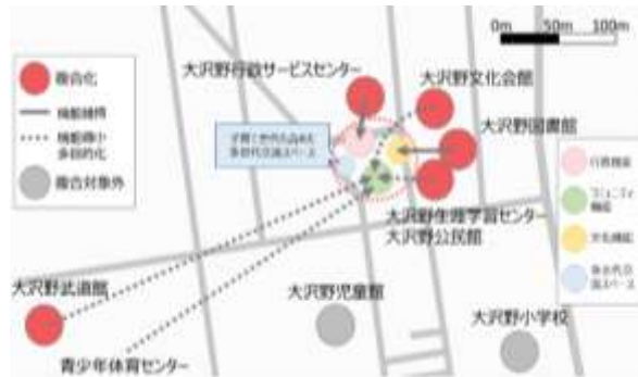
ファシリティマネジメント