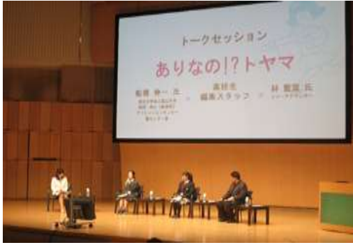
高校生と富山を語るプロジェクト 「ありだね！」講演会