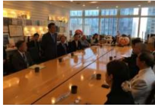
海外の旅行事業者向けのプロモーション