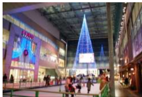
クリスマスツリー型イルミネーションとエコリンク