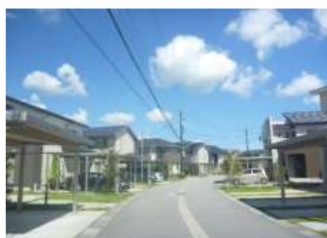
公共交通沿線の居住推進（婦中町夢ヶ丘地区）