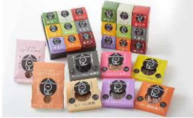
食やくシリーズ（富山のお土産）