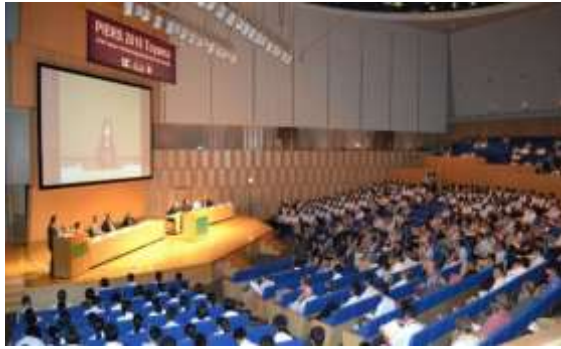
国際会議の開催支援