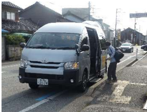
市営コミュニティバス（大山地域）