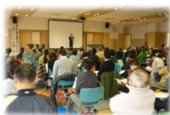
まちぐるみ健康づくり交流会