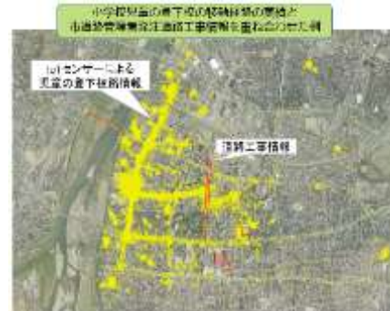
センサーネットワークによる行動解析