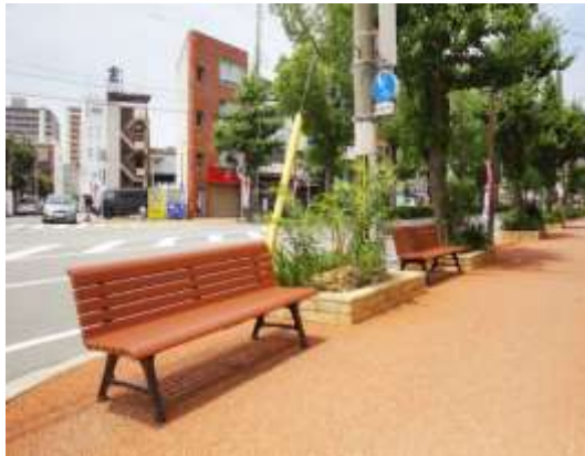
ベンチプロジェクト（イメージ）