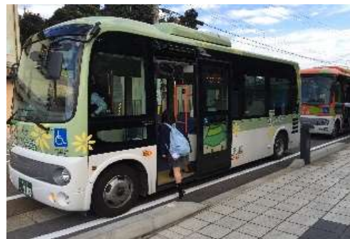
地域自主運行バス（呉羽地域）