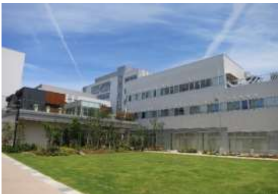
まちなか総合ケアセンター