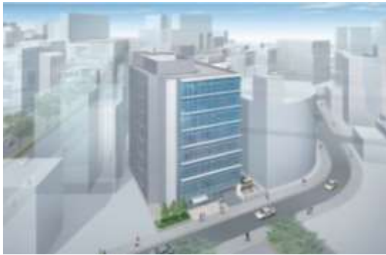
本庁舎北側公有地活用事業