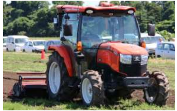
スマート農業の実証（ロボットトラクタ）