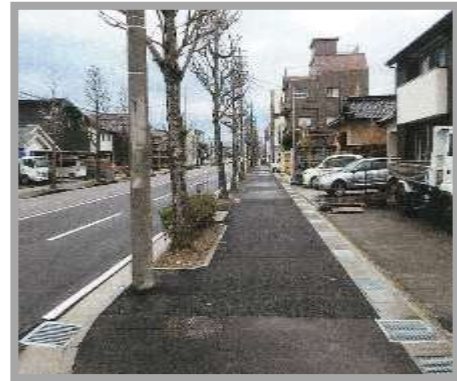
歩道のリフレッシュ整備