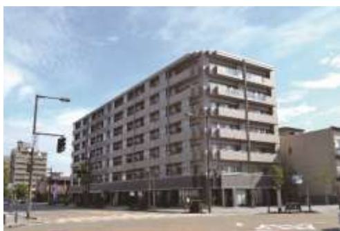
まちなか居住の推進（総曲輪地区）