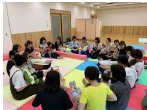
健康長寿コンシェルジュ・サービス（親子サークル）