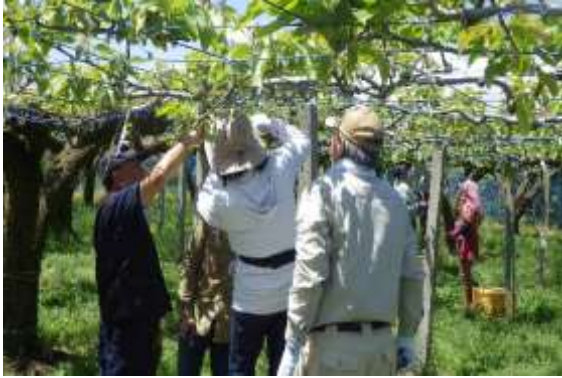
果樹講座（農業サポーター養成コース）