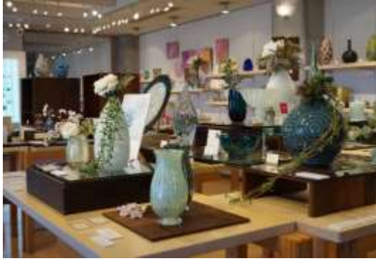
富山ガラスのショップ（富山ガラス工房内）