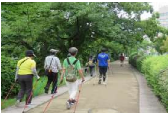
健康長寿コンシェルジュ・サービス（ノルディックウォーキング）