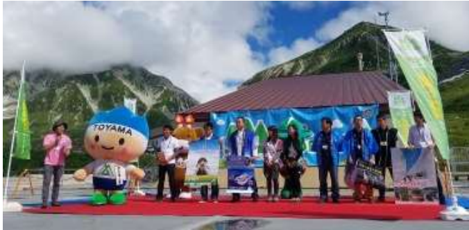
連携中枢都市圏事業（合同観光プロモーション）