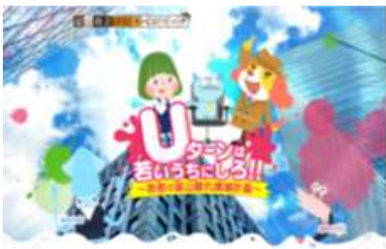
富山市就活全力応援サイト