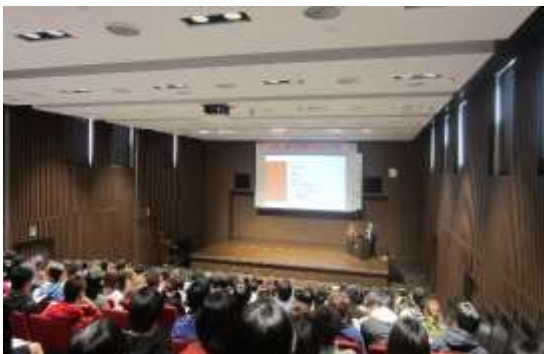
妊娠・出産を考えるフォーラム