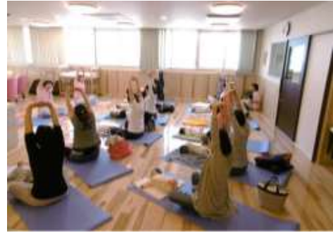
連携中枢都市圏事業（産後ケア）