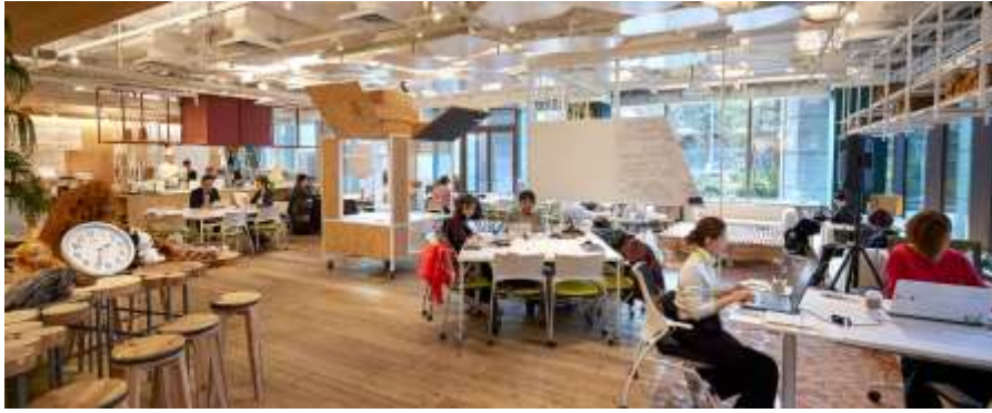
「とやまシティラボ」イメージ