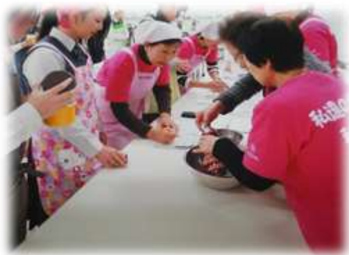
「食生活改善推進員」による調理実習