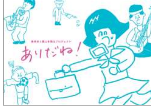
若者向け PR ブック「ありだね！」