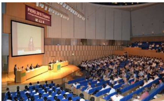
国際会議の開催支援