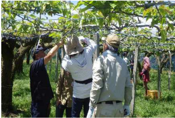
果樹講座（農業サポーター養成コース）