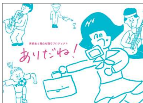
若者向け PR ブック「ありがだね！」