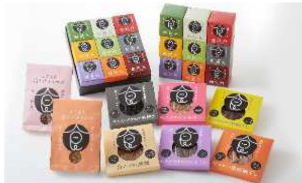
食やくシリーズ（富山のお土産）