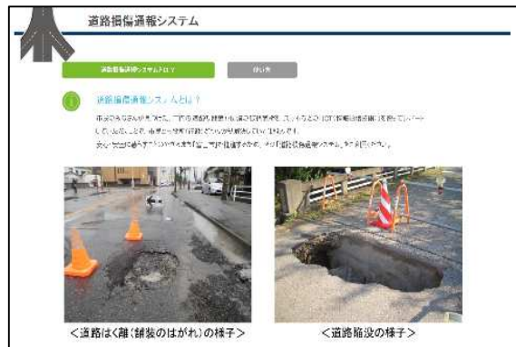
ライフライン共通プラットフォーム