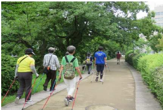
健康長寿コンシェルジュ・サービス（ノルディックウォーキング）