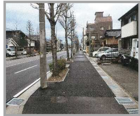
歩道のリフレッシュ整備