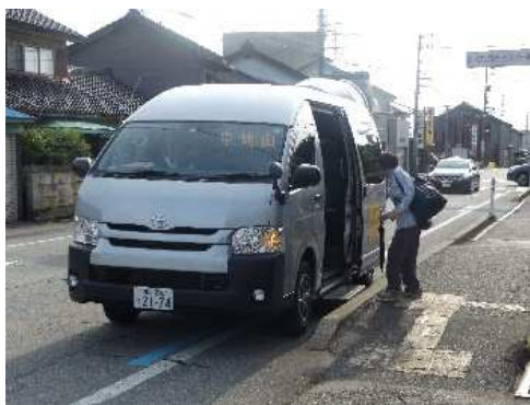
市営コミュニティバス（大山地域）