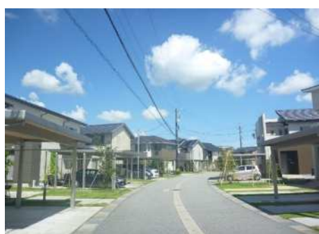
公共交通沿線の居住推進（婦中町夢ヶ丘地区）