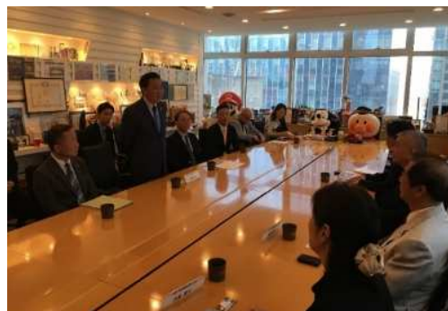
海外の旅行事業者向けのプロモーション