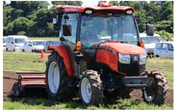
スマート農業の実証（ロボットトラクタ）