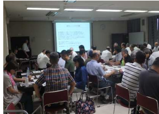
自主防災組織リーダー研修会