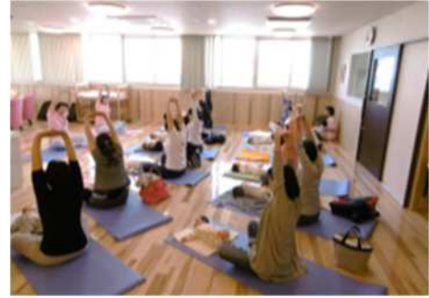
連携中枢都市圏事業（産後ケア）