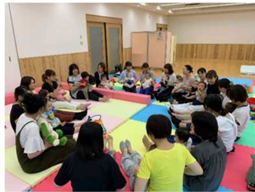
健康長寿コンシェルジュ・サービス（親子サークル）