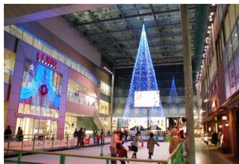
クリスマスツリー型イルミネーションとエコリンク