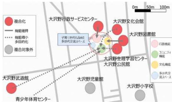
ファシリティマネジメント