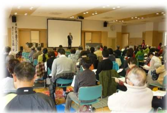
まちぐるみ健康づくり交流会