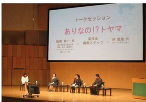
高校生と富山を語るプロジェクト 「ありだね！」講演会