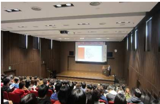
妊娠・出産を考えるフォーラム