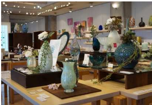
富山ガラスのショップ（富山ガラス工房内）