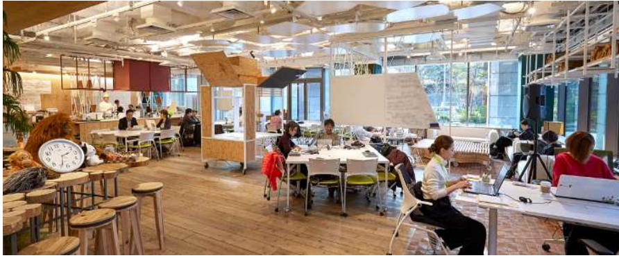
「とよまシティラボ」イメージ（エコツェリア協会ホームページより引用）