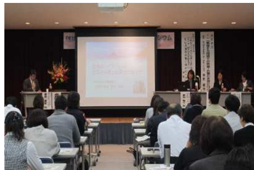
妊娠・子育て応援シンポジウム