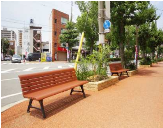
ベンチプロジェクト（イメージ）