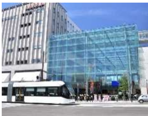
セントラムとグランドプラザ