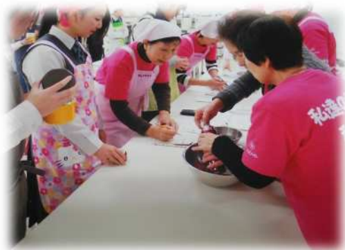
「食生活改善推進員」による調理実習