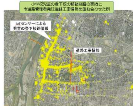
センサーネットワークによる行動解析