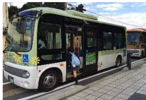
地域自主運行バス（呉羽地域）