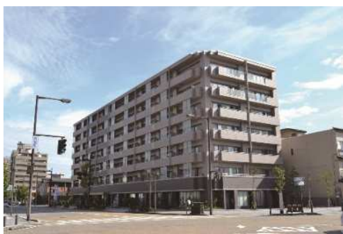
まちなか居住の推進（総曲輪地区）