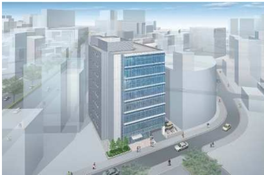
本庁舎北側公有地活用事業