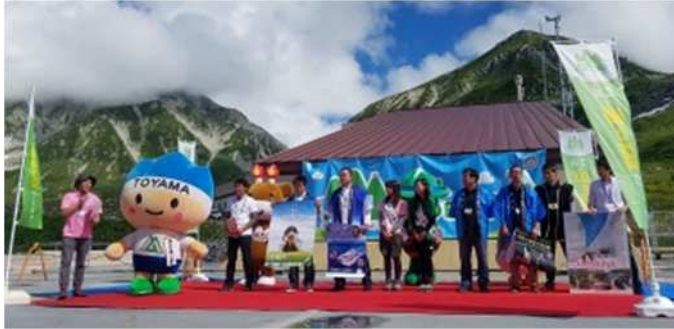
連携中枢都市圏事業（合同観光プロモーション）