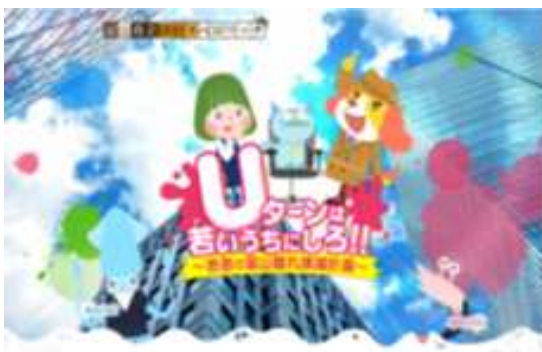
富山市就活全力応援サイト