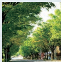
[富山市の木] ケヤキ

富山市では平成21年5月に市の木、花木、草花を制定し、緑化のシンボルとしています。