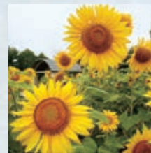
[富山市の草花] ヒマワリ