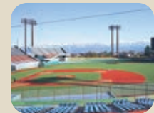
18 富山市民球場(アルペンスタジアム)