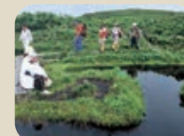
32 白木峰 21世紀の森