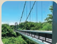
20 呉羽丘陵フットバス連絡橋