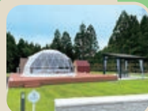
36 剗山森林公園 天湖森