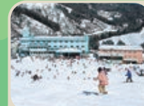
27 牛岳温泉スキー場