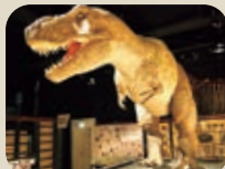
18 富山市科学博物館