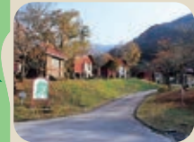
42 立山麓家族旅行村