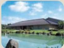
13 富山県水墨美術館