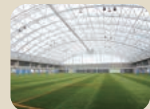
40 アイザックススポーツドーム