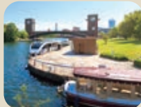
16 富岩運河環水公園