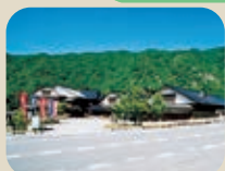
35 神通峡岩稲温泉 楽今日館