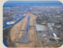
11 空の玄関口、富山空港。日本で唯一、河川敷に作られた空港。