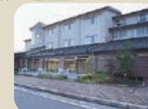
28 八尾ゆめの森ゆうゆう館