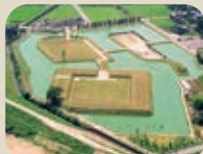
24 安田城跡 歴史の広場