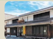
28 八尾おわら資料館