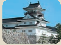
8 富山市郷土博物館(富山城) 富山城址公園