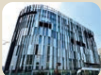
17 富山市ガラス美術館・図書館本館