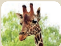
23 富山市ファミリーパーク