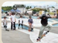
26 富山市ストリートスポーツパーク (NIXストリートスポーツパーク)