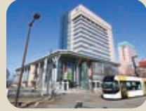
9 富山市芸術文化ホール(オーバード・ホール)