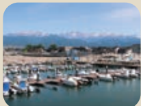
19 水橋フィッシャリーナ