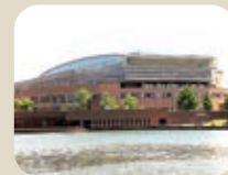
17 富山市まちなかアリーナ(YKK AP ARENA)