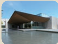
14 高志の国 文学館