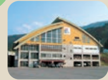
43 大山農山村交流センター