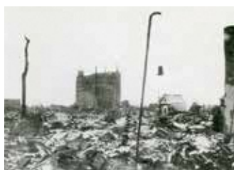
▲焦土と化した富山市街地