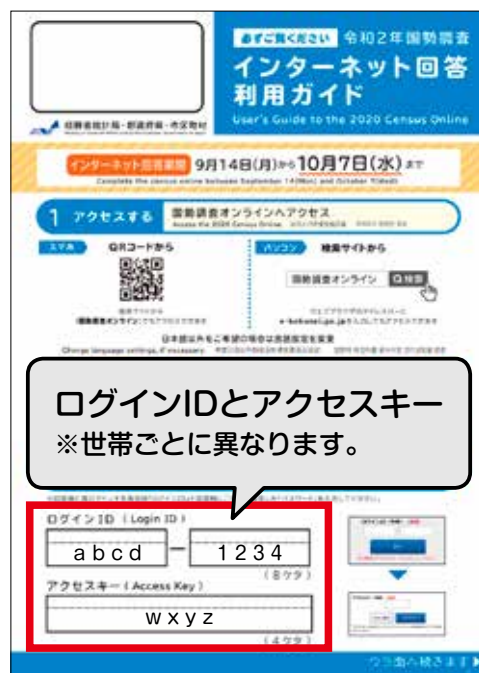
▲インターネット回答利用ガイド

回答データを保護するため、パスワードを設定した後、「送信」ボタンを押してください。以上で、回答は終了です。