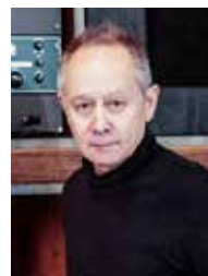
ピーター・バラカンさん