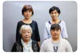
読み聞かせボランティアピノキオ