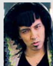
◀パークマンサーさん

「エゴマ」はシソ科の植物です。α-リノレン酸などの健康成分が多く含まれており、近年とても注目されています。