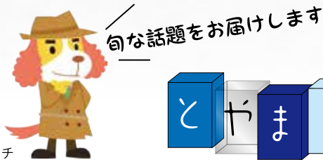
市立探偵ペロリッチ