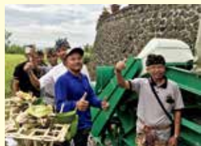
▲水車の設置を喜ぶ現地住人

富山市内の企業と連携し、ユネスコの世界文化遺産であるジャティルウィ村の棚田群の用水路に、4基の小水力発電システムを設置しました(2017年11月)。