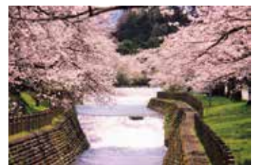
常西用水プロムナード (上滝地内)