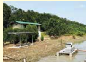
▲発電された電力は、公園内の管理施設に使用されています。