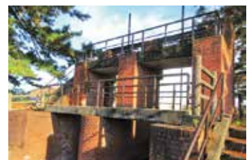
明治時代に造られた 新庄の赤門(常盤地内)