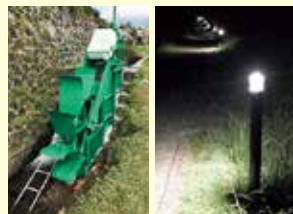
▲発電された電力は、200本の街灯などに使用されています。