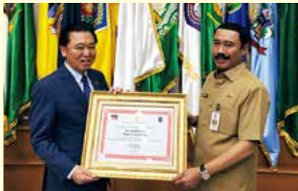
▲富山市の取り組みが高く評価され、日本の自治体として初めて、インドネシア政府から感謝状が贈られました(2018年9月)。

また、国際的な信用の高まりは、シビックプライド(わがまちへの愛着や誇り)の醸成につながり、富山市内の企業の海外進出による事業の拡大は、雇用機会の増加や経済への波及効果が期待されます。