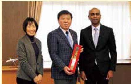
▲富山市の取り組みに関心を持ったモルディブ共和国大使が本市を訪問し、森市長と意見交換を行いました(2020年1月)。