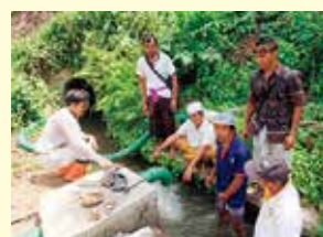
▲米の生産量増加や農家の所得向上が期待されます。

※諸外国におけるこれらの国際連携事業は、現地国の資金や環境省・経済産業省・国際協力機構(JICA)の資金援助を受けて実施されています。