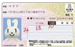
▲マイナンバーカード