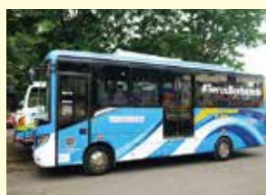
▲改造されたバスは、最大約40%のCO 2 削減が期待されます。