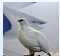
▲ニホンライチョウ

ニホンライチョウの生態や体の特徴、野生での現状と保全などについて解説します。 日時／2月21日(日)13:00~13:30 場所／ライチョウ舎 費用／入園料のみ ※申込不要。