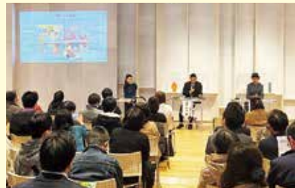
▲外務省の政府開発援助(ODA)*の啓発イベントでは、富山市内の企業の海外での取り組みが紹介されました(2020年2月)。