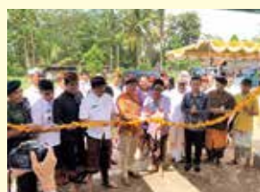
▲現地での運転開始式

慢性的な農業用水不足解消のため、太陽光発電を活用した揚水ポンプ設備の導入プロジェクトを国立ウダヤナ大学と連携して実施し、富山市内の企業の施工により運転を開始しました(2020年1月)。