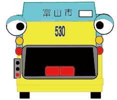
▲環境センターオリジナルキャラクター バックカーくん

市は、「脱・埋め立て」による循環型のまちづくりを目指し、市民一人一人の「3R」実践行動による、ごみの減量化と分別リサイクルの推進に取り組んでいます。