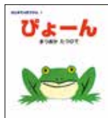
まつおかたつひで作・絵 ポプラ社

ロングセラー絵本「ぴょーん」をはじめ、「海べのいきもの」(福音館書店)など、原画約80点を展示します。