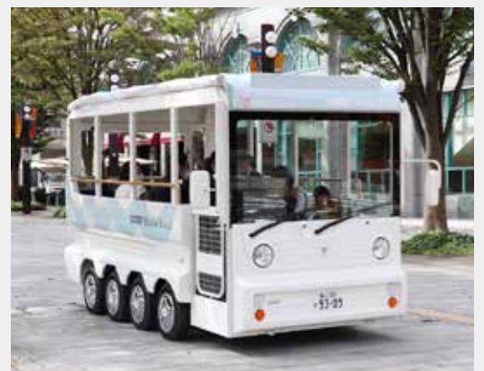
▲グリーンスローモビリティ「Boule BaaS」

※天候や周辺でのイベント開催などにより、運行状況が変更となる場合があります。運行情報はフェイスブック、ツイッター、インスタグラム(ハッシュタグ「#ブルバース」で検索)に掲載しています。