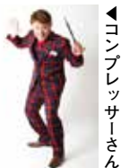
コンプレッサーさん

まちなかを舞台に、マジックや大道芸などが繰り広げられます。県内外のエンターテイナーによる驚くような「スゴ技」をお楽しみください。