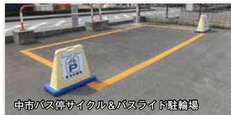
中市バス停サイクル&バスライド駐輪場

自宅から自転車とバスを乗り継いで目的地まで移動する方のために、バス停の近くに専用駐輪場を整備しています。