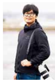
イナガキヤストさん