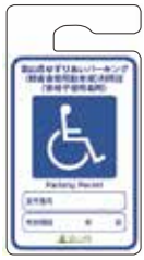
車いす使用者 (青色)