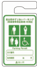
車いす使用者以外 (緑色)