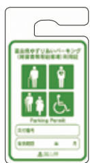
車いす使用者以外 (緑色)