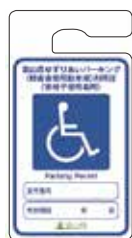
車いす使用者 (青色)