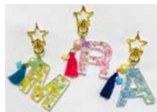
ゆめかわイニシャルキーホルダー