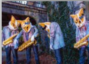
サクソフォックス