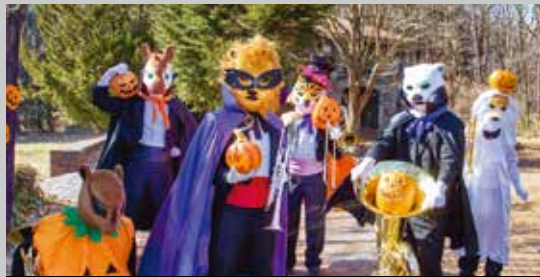
ズーラシアンブラス