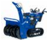
小型除雪機械 (ハンドガイド式)

地域の皆さんと連携し、協力して除雪を行うため、大型・小型除雪機械を貸し出します。