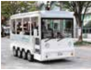
グリーンスローモビリティ BouleBaaS

※天候により、運行内容が変更となる場合があります。時刻表などの詳細は市ホームページ(「グリーンスローモビリティ」で検索)で確認してください。