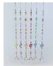
キラキラ サンキャッチャー