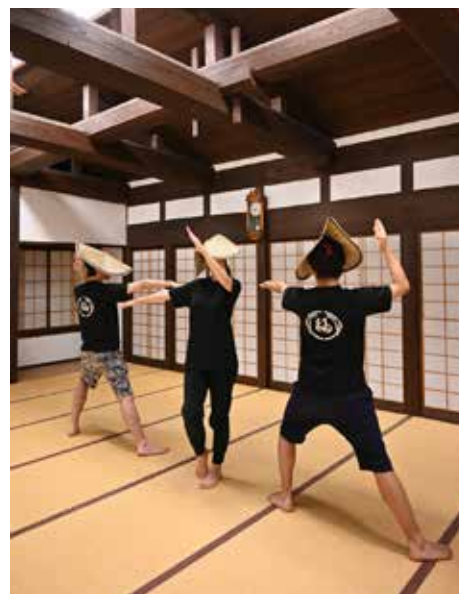
越中八尾おわら保存会福島支部 青年の練習

★ライブ配信については、越中八尾観光協会 おわら風の盆ホームページ ( https://www.yatsuo.net/kazenobon/ ) をご覧ください。