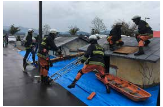
倒壊建物からの救助訓練