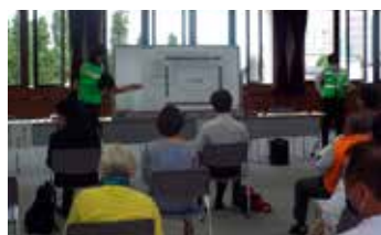
「市災害ボランティア本部」訓練の様子