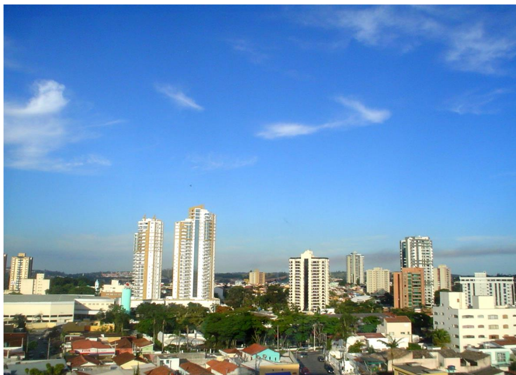
モジ・ダス・クルーゼス市内

日本国富山県富山市は、ブラジル連邦共和国サンパウロ州モジ・ダス・クルーゼス市と相互に文化・教育・経済・産業の交流を図り、両市の友好親善を深めるとともに世界の平和と繁栄に貢献することを念願しここに両市が姉妹都市として提携することを宣言する。