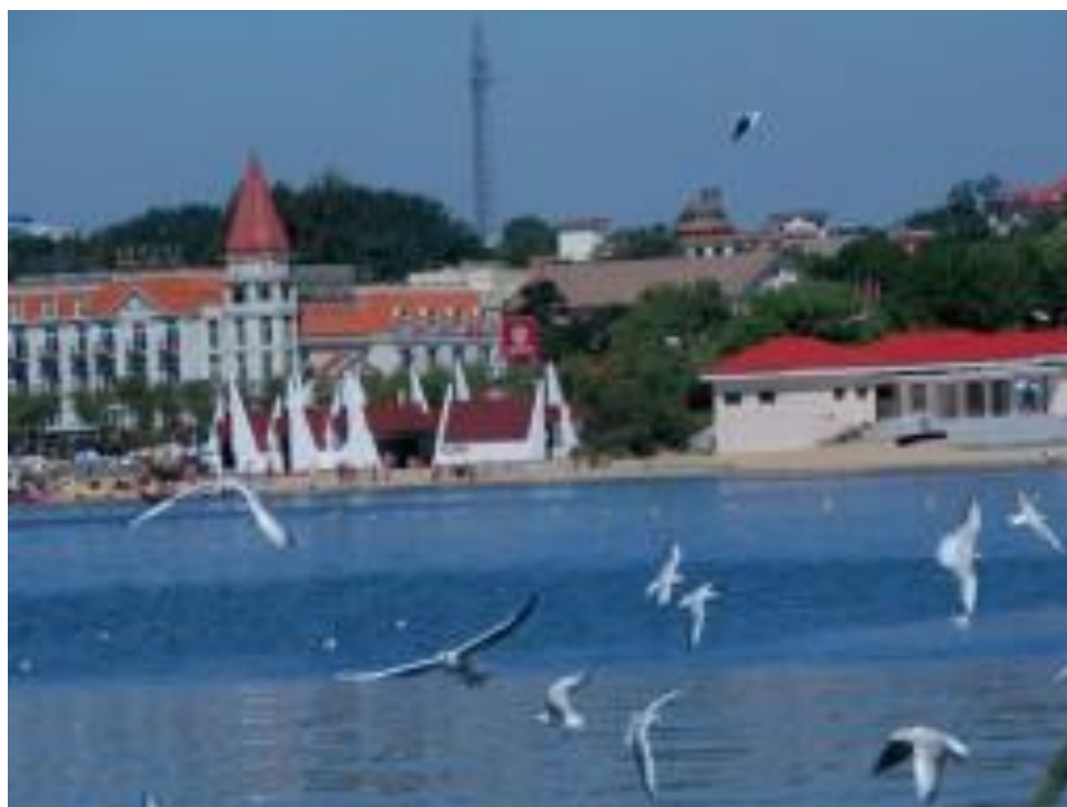
秦皇島避暑地北戴河