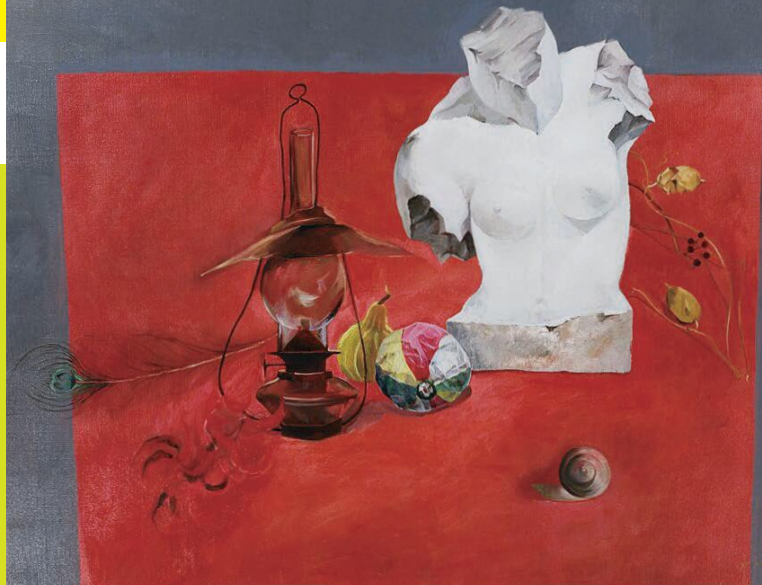
「トルソのある景（赤い卓の景）」広田 揚二 洋画