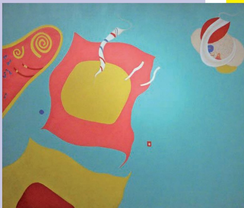
「そっとつかまえて（1967年）」野上 祇麿 洋画