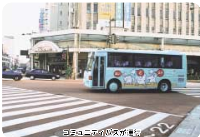
コミュニティバスが運行