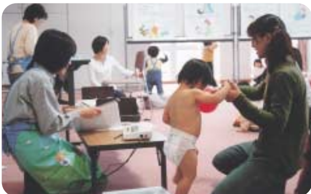
子供たちの健やかな成長を願って