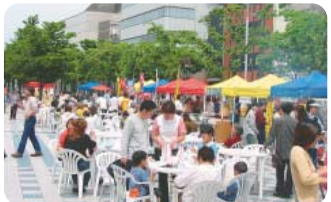
新たなにぎわいの創出・越中大手市場