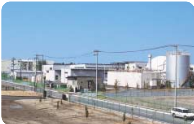
環境産業の拠点となる富山市エコタウン