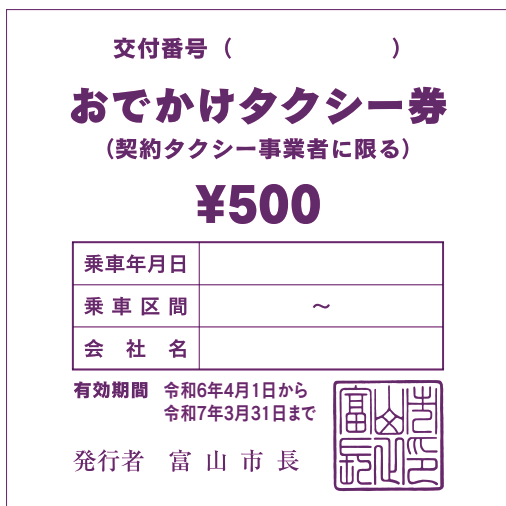
おでかけタクシー券