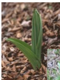
芽出し期の バイケイソウ