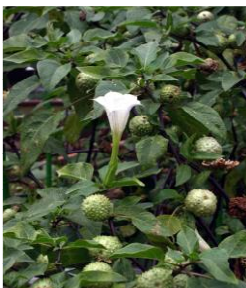
チョウセンアサガオの葉と花