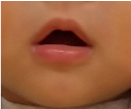
おうちぼかん (口のしまりがいい)