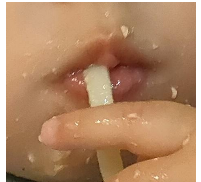
もぐもぐ (よく動くお口)